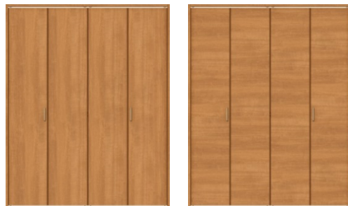
□LAA縦木目 □LAB横木目 □LAA縦木目 □LAB横木目