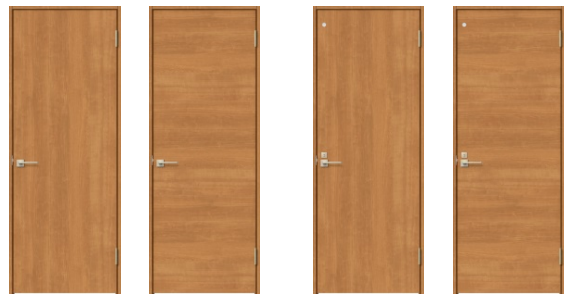
□LAA縦木目 □LAB横木目 □LAA縦木目 □LAB横木目