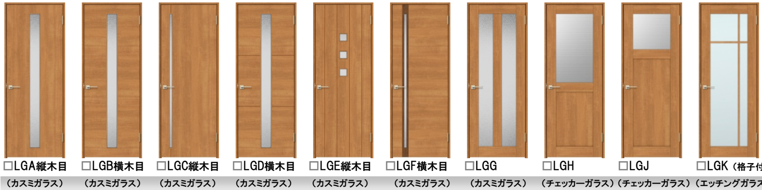
□LGA縦木目 (カスミガラス) □LGB横木目 (カスミガラス) □LGC縦木目 (カスミガラス) □LGD横木目 (カスミガラス) □LGE縦木目 (カスミガラス) □LGF横木目 (カスミガラス) □LGG (カスミガラス) □LGH (チェッカーガラス) □LGJ (チェッカーガラス) □LGK (格子付) (エッチングガラス)