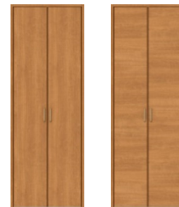
□LAA縦木目 □LAB横木目 □LAA縦木目 □LAB横木目